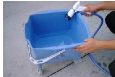
専用バケツに 4L の水を入れ ます。(5L 目盛の少し下まで)