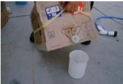
計量カップに 200cc J-SHOP500 を取ります。