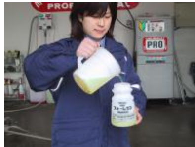
フォームガンに軽量カップから 原液を注ぎます。