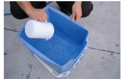
カップの洗剤を注ぎます。