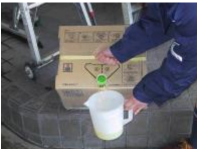
J-SHOP 500 を軽量カップに 入れます。