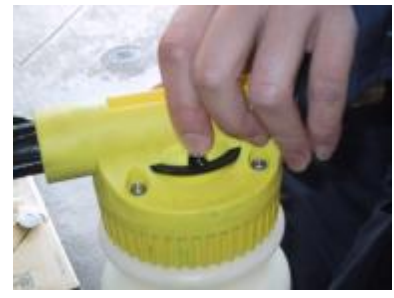
キャップを閉めて、希釈が 20 倍なのでダイヤルを「1」 にあわせます。